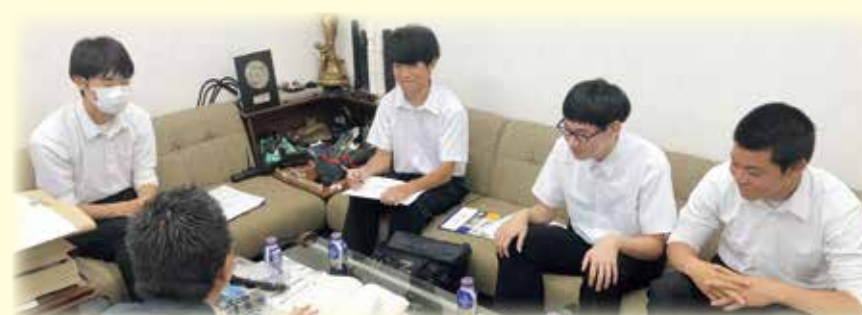
「先輩、教えてください!」(インターンシップ)

11月 マラソン大会 2年修学旅行(広島・関西方面)(3泊4日) 1年科学リテラシー(東京・筑波方面)研修旅行(1泊2日)