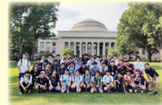
米国研修(マサチューセッツ工科大学)