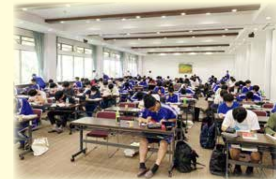
学習合宿(湯の丸高原)