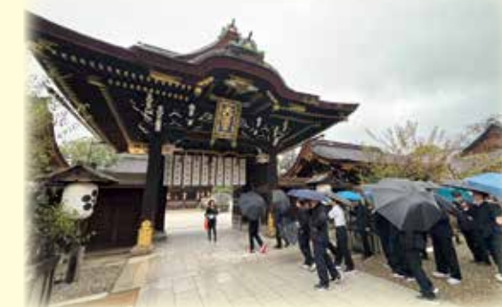
修学旅行(広島・関西)