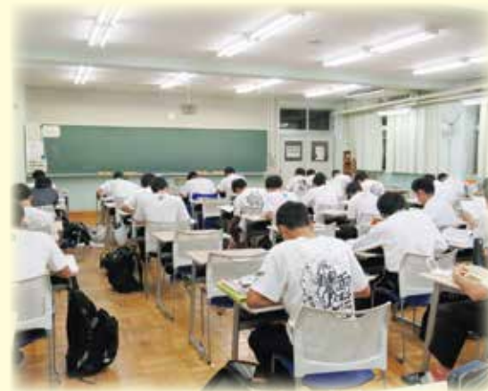
学習室（夜9時まで利用可能）