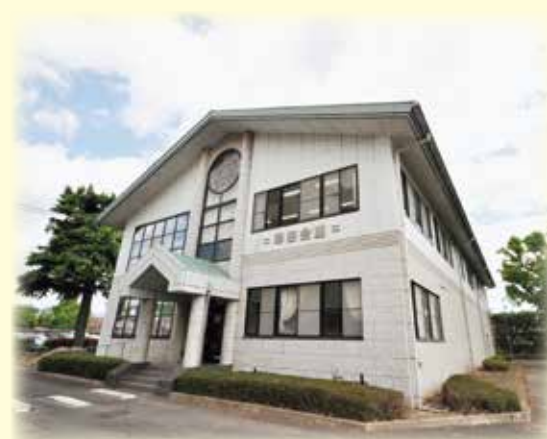
翠巒会館（同窓会館）