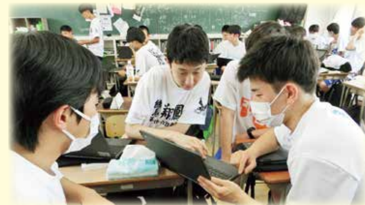
授業風景（課題研究）