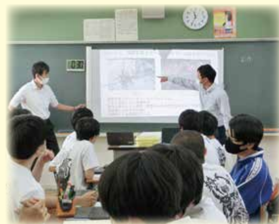
授業風景（クロスカリキュラム授業）