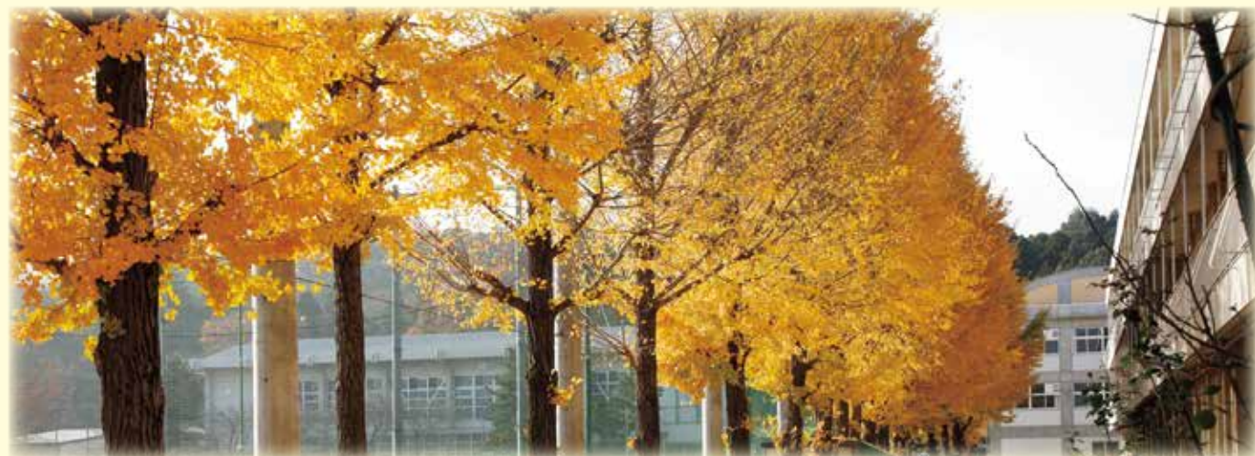
イチョウ並木と校舎