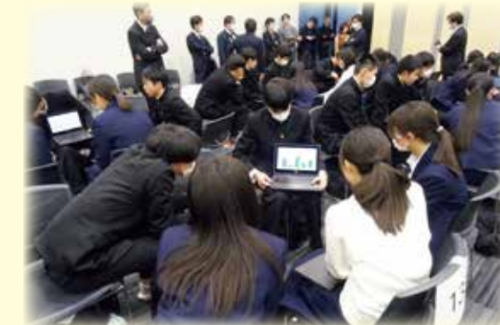
高崎女子高校との合同SSH発表会