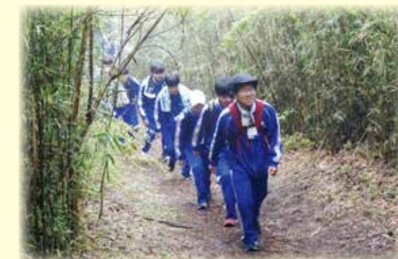
赤城オリエンテーション合宿