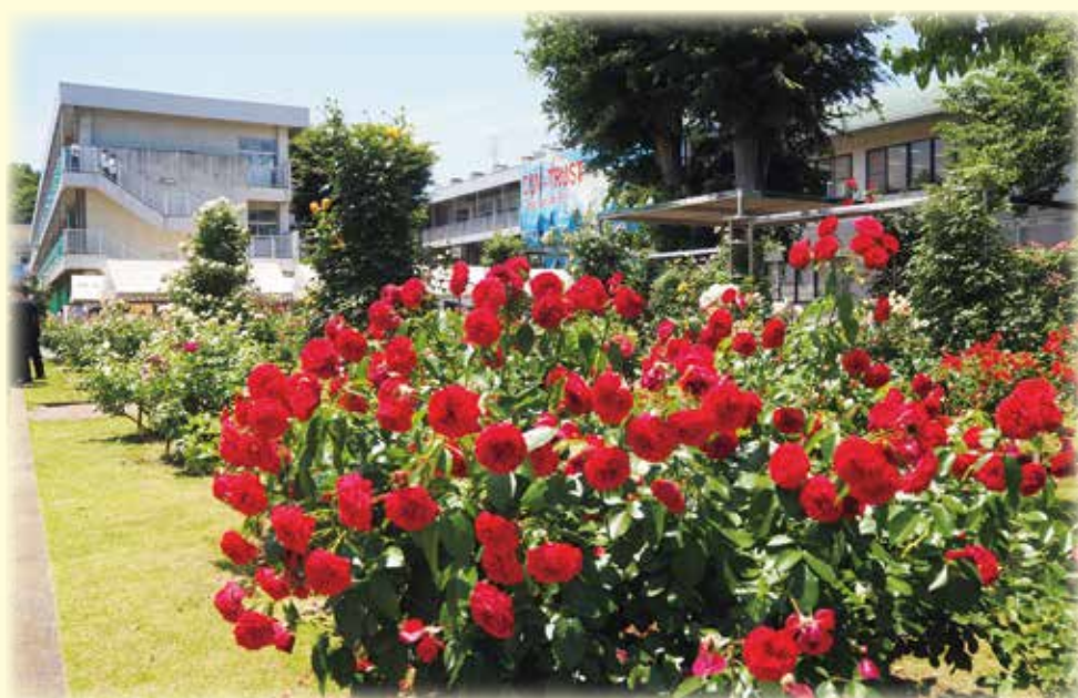
指月庭（バラ園）と校舎