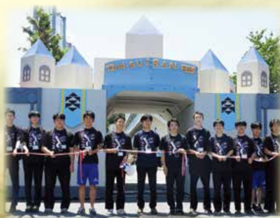
翠巒祭（正門アーチ）