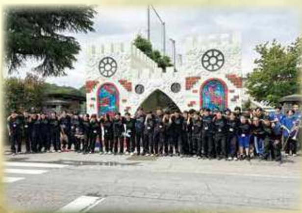
翠巒祭（正門アーチ）