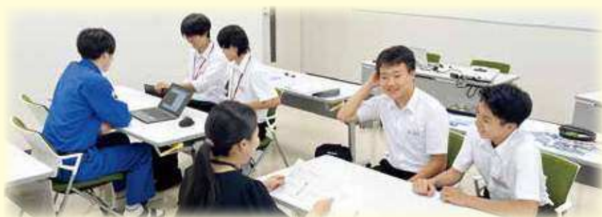
「先輩、教えてください!」(インターンシップ)