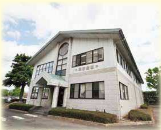
翠巒会館（同窓会館）