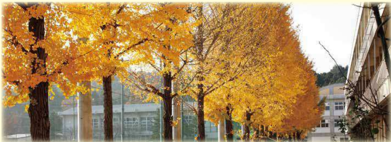
イチョウ並木と校舎