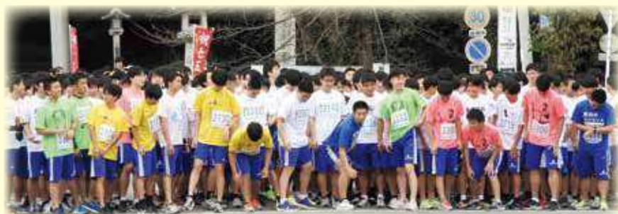
マラソン大会・スタート前