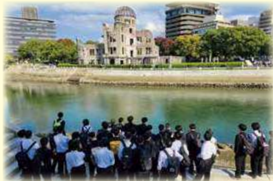
修学旅行(原爆ドーム)