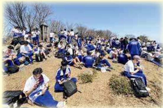
赤城オリエンテーション合宿(鍋割登山山頂にて)