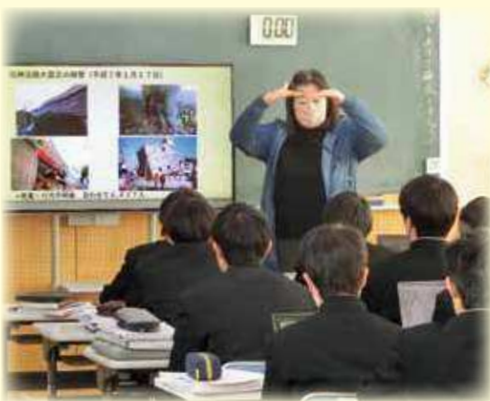
授業風景（クロスカリキュラム授業）