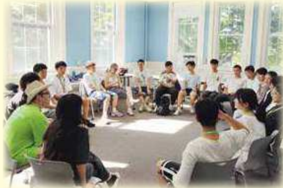
米国研修(語学学校での授業風景)