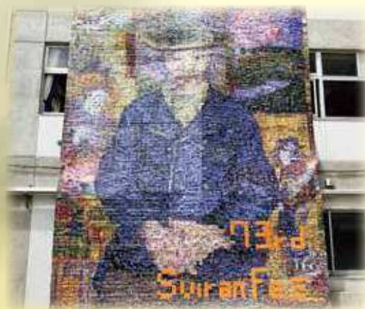
翠巒祭（フォトモザイク）