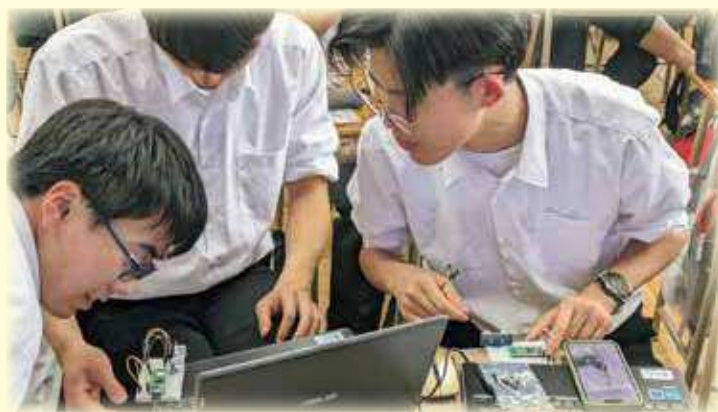
授業風景（課題研究）