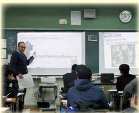
授業風景（クロスカリキュラム授業）