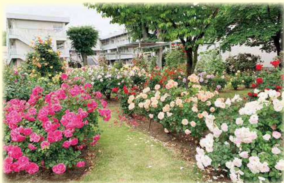
指月庭（バラ園）と校舎