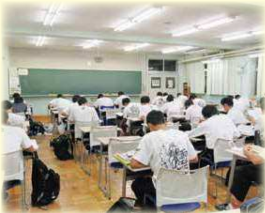
学習室（夜9時まで利用可能）