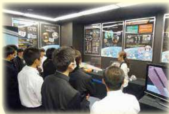
科学リテラシー研修旅行

2年修学旅行(広島・関西方面)(3泊4日) 1年 科学リテラシー(東京・筑波方面)研修旅行 (1泊2日) ハワイ研修(希望者)