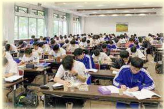
学習合宿(湯の丸高原)