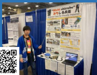
「国際学生科学技術フェア」 アメリカ