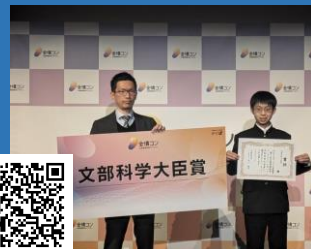
「全国情報教育コンテスト」