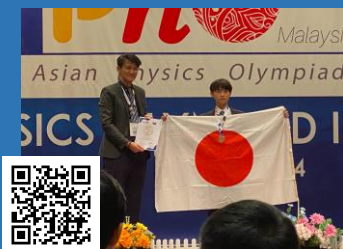
「アジア物理オリンピック」 「ヨーロッパ物理オリンピック」 マレーシア、ジョージア