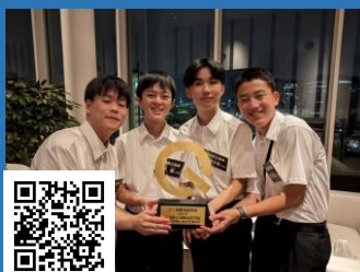
「Q-1～U-18が未来を変える」 ★研究発表SHOW」 (林修さんMCの全国大会)