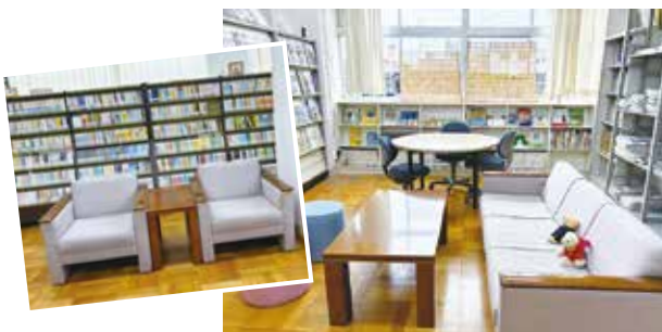
新しくできたソファコーナーが人気！