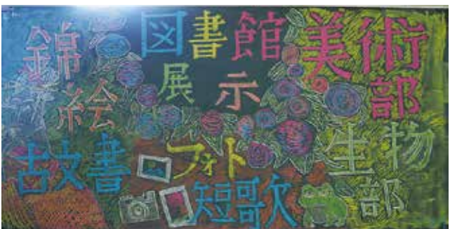
入口の黒板アート